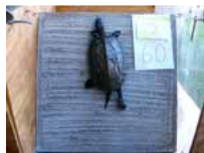
写真-9 カメ 表面2