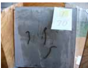
写真-8 ミミズ 表面1、湿、70度